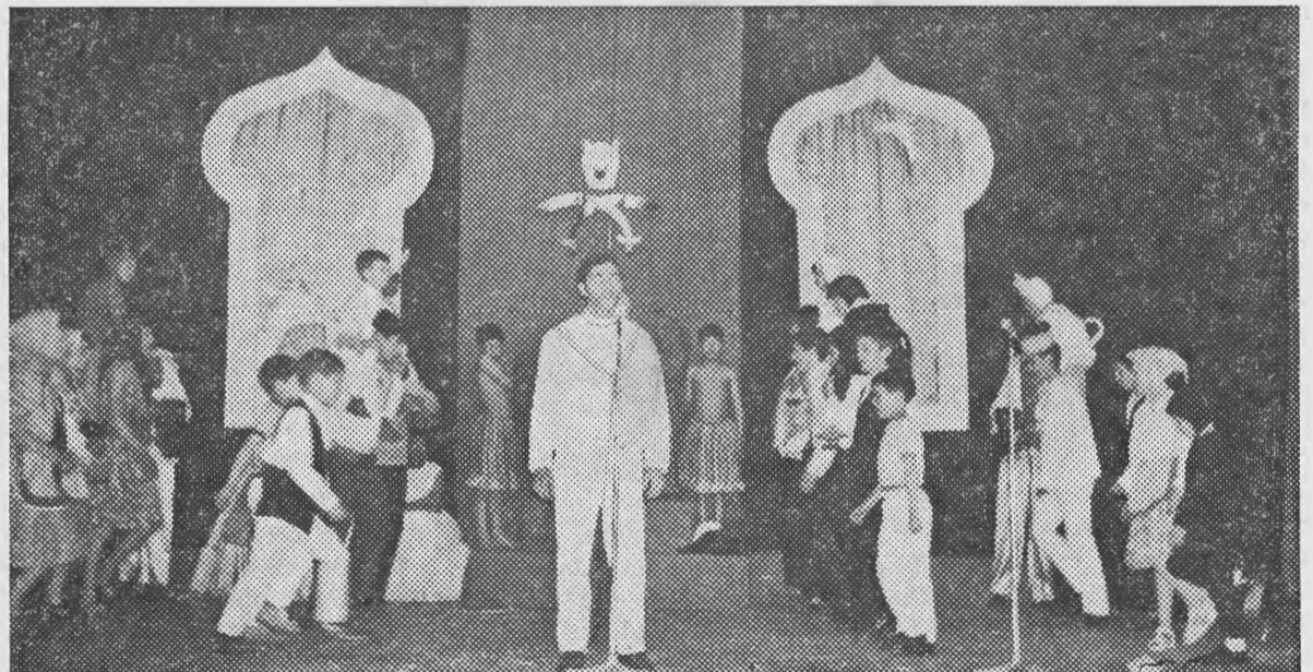
Mais um sugestivo quadro das Festas da nossa Casa de Miranda do Corvo — o ano passado.